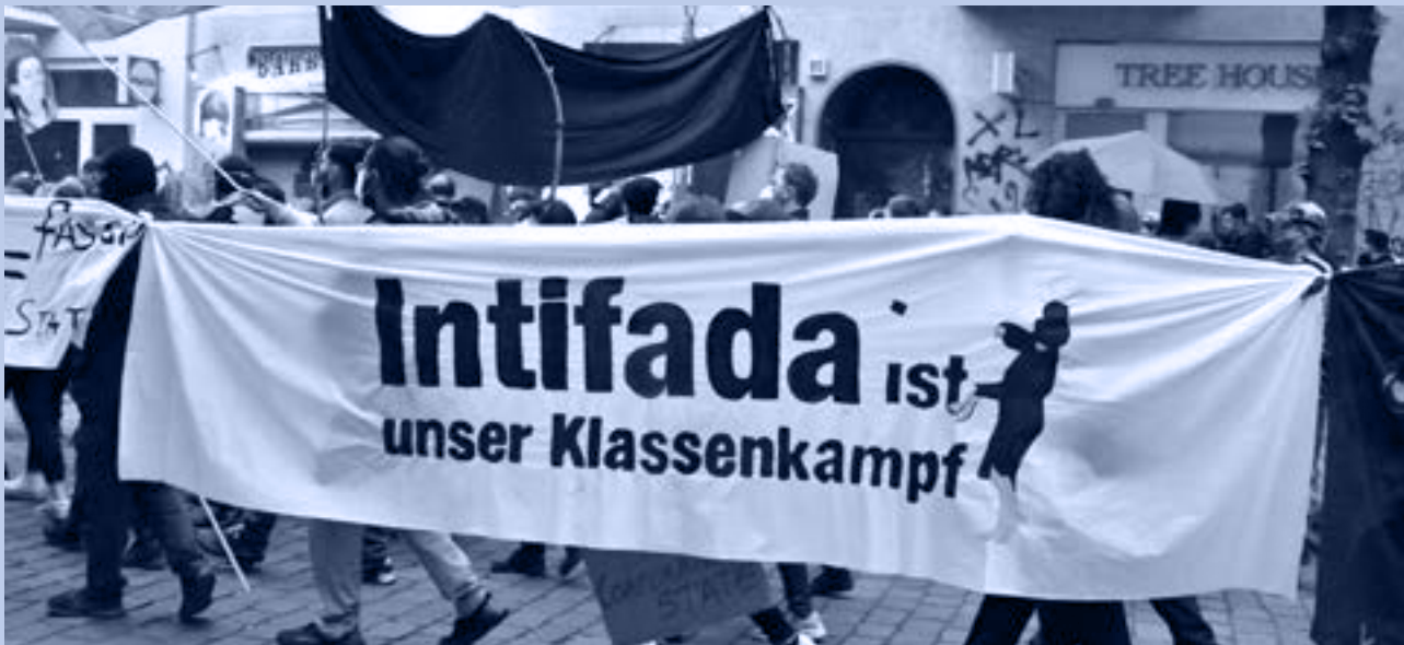
Transparent auf einer Demonstration in Neukölln, 2023

schaftsbildendes Ideologiefragment, das insbesondere linksradikale und islamistische Akteure zusammenführt, gemeinsame Feindbilder stiftet und Radikalisierungsprozesse beschleunigt. Maßgeblich befördert wird diese Dynamik durch eine antisemitische Online-Kommunikation, was etwa durch den positiven Bezug auf den seit 2021 firmierenden Begriff einer „TikTok-Intifada“ verdeutlicht wird.