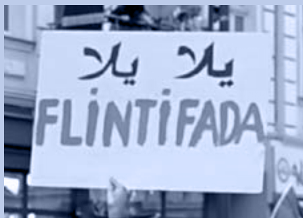
Plakat beim Dyke-March 2025, Berlin

linke Kritik auf dem Gebiet des Antisemitismus und Antizionismus zu formulieren. Dabei waren vor allem die Erkenntnisse der kritischen Theorie maßgeblich. Moishe Postone knüpfte in mehreren Aufsätzen an die Marxsche Kritik der kapitalistischen Ökonomie an und entwickelte daraus eine