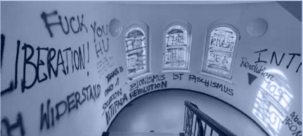
Sachbeschädigung und Schmierereien bei einer Besetzung der HU-Berlin, 2025

sche Gegenüber als das absolut Böse oder als bloße Verkörperung des Unterdrückers definiert, wird jede menschliche Regung des Mitgefühls blockiert. Das warme Gefühl der inneren Solidarität nährt sich direkt aus einer emotionalen Kälte gegen-