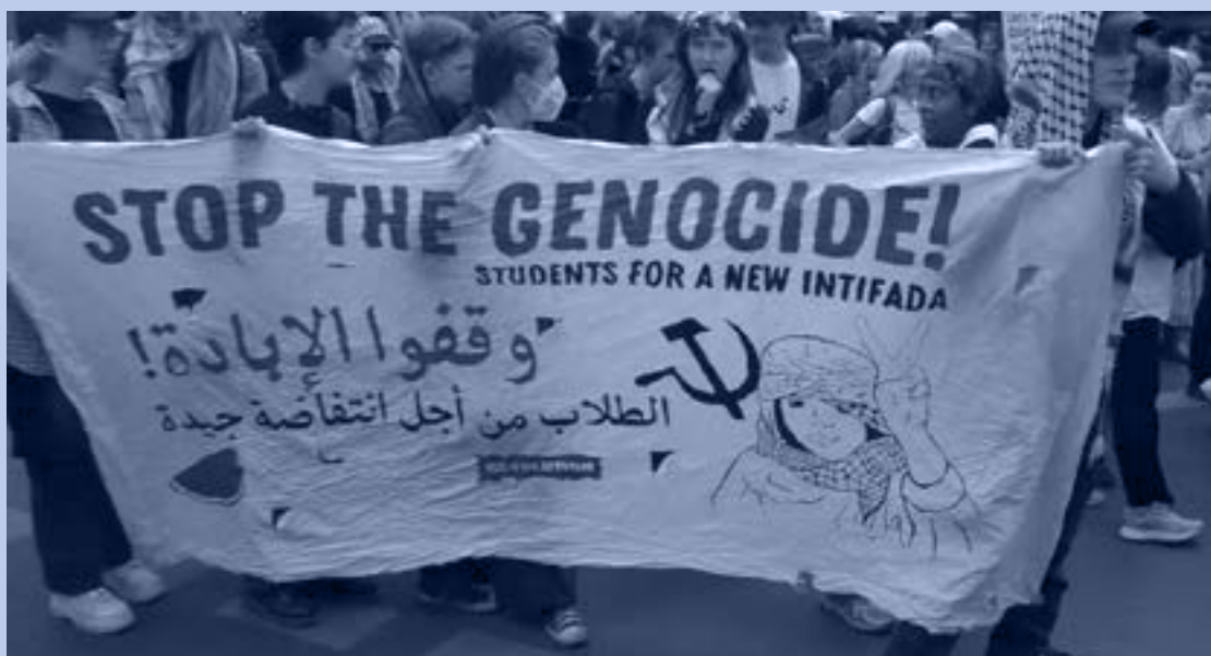
Transparent auf einer Schulstreikdemonstration in Berlin, 2024

denen sozialen und politischen Krisen heraus, die durch den Zerfall des Osmanischen Reiches nach dem Ersten Weltkrieg im dann zu Großbritannien gehörenden Mandatsgebiet Palästina begünstigt wurde, so konnten sich in seinem Verlauf kompromisslose arabisch-nationalistische Gruppen durchsetzen. Diese vertraten einen Kurs gegen jede jüdische Einwanderung ins Mandatsgebiet, die sich vor allem nach der Machtübernahme der Nationalsozialisten im Deutschen Reich 1933 stark erhöht hatte. Der Mufti von Jerusalem, Mohammed Amin al-Husseini, ließ etwa verlautbaren: „Im Zentrum der ganzen Revolte, dieses arabischen Aufstands, steht eine Frage: die Frage der Alija [Ein-